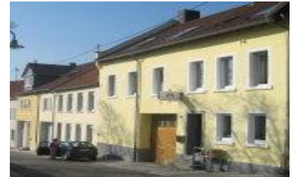
Das Weingut an der historischen Kaiserpfalz